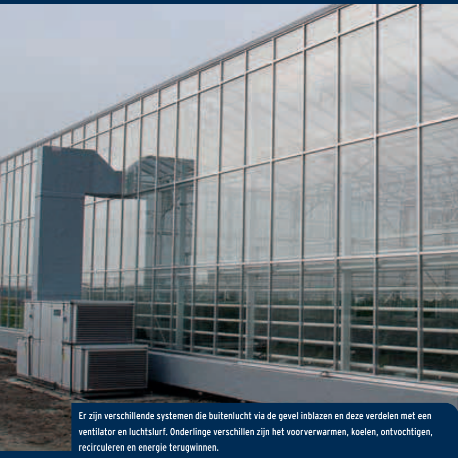
Er zijn verschillende systemen die buitenlucht via de gevel inblazen en deze verdelen met een ventilator en luchtslurf. Onderlinge verschillen zijn het voorverwarmen, koelen, ontvochtigen, recirculeren en energie terugwinnen.

Ontvochtigen van de kas met buitenlucht is op zichzelf niets nieuws. Nieuw is dat de buitenlucht geforceerd in de kas wordt gebracht met een ventilator en een verdeelsysteem. Hierdoor kan een teler vaker en beter schermen, mits hij tegelijkertijd zorgt voor voldoende luchtbeweging. Diverse fabrikanten hebben hiervoor een eigen systeem ontwikkeld met uiteenlopende eigenschappen wat betreft werking, investeringskosten en energieverbruik. In dit artikel een samenvatting van de basisprincipes die ten grondslag liggen aan een energiezuinig microklimaat met de plant als uitgangspunt.