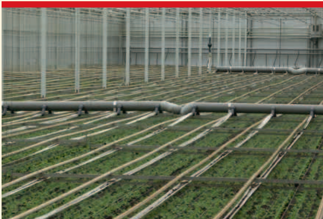
Praktijkproef bij Matricaria. In het proefvak wordt door dunne luchtslangen aan de buisrail, te vergelijken met CO 2 darmen, lucht ingeblazen onderin het gewas.

In de tweede plaats kunnen telers de schermen in de toekomst veel intelligenter inzetten. Bijvoorbeeld omdat in