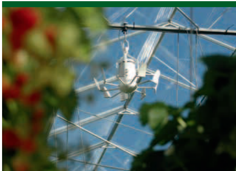
Op basis van verschillende koelsystemen op zijn bestaande bedrijf, koos Dings in zijn nieuwe kas voor een vernevelingsinstallatie en een aircobreeze.

Met name het aanbrengen van de bodemisolatie is een goedkope oplossing, vindt de aardbeienteler. Het is immers een